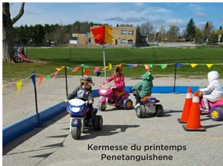
Kermesse du printemps Penetanguishene