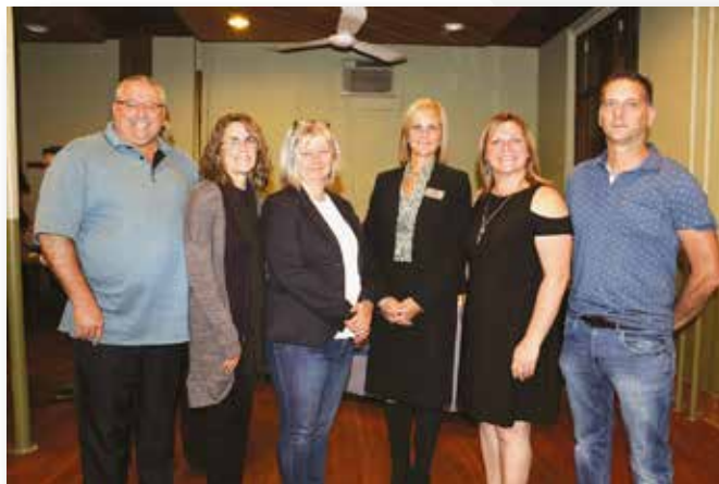
AGA - 29 septembre 2017 - Penetanguishene

Le conseil d'administration de La Clé est composé de 8 membres provenant de la communauté, élus pour un mandat de deux ans. Les responsabilités du conseil sont de gouverner l'organisme en établissant des politiques et en définissant des objectifs stratégiques, de surveiller les cadres supérieurs, dont la direction générale, assurer la disponibilité des ressources financières, approuver les budgets annuels et rendre compte aux parties prenantes de la performance de l'organisme.