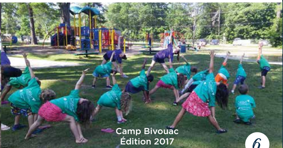
Camp Bivouac Édition 2017