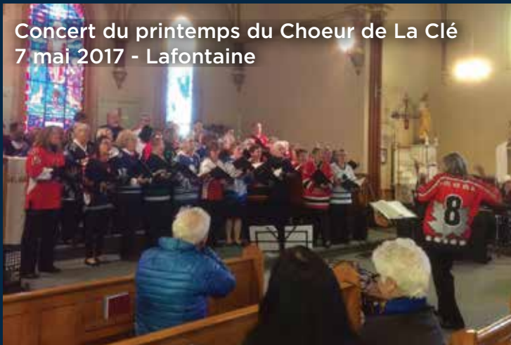
Concert du printemps du Choeur de La Clé 7 mai 2017 - Lafontaine