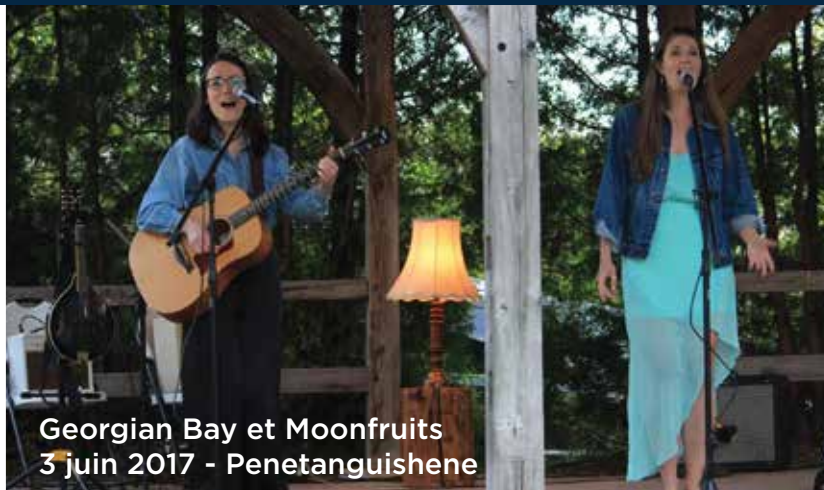
Georgian Bay et Moonfruits 3 juin 2017 - Penetanguishene