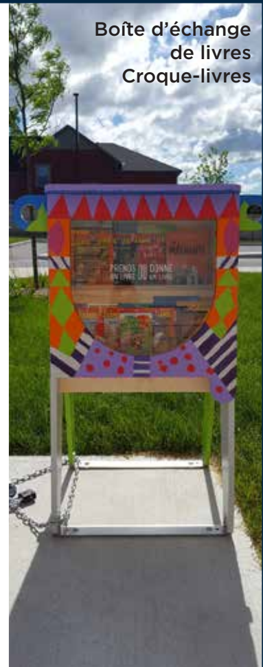
Boîte d'échange de livres Croque-livres