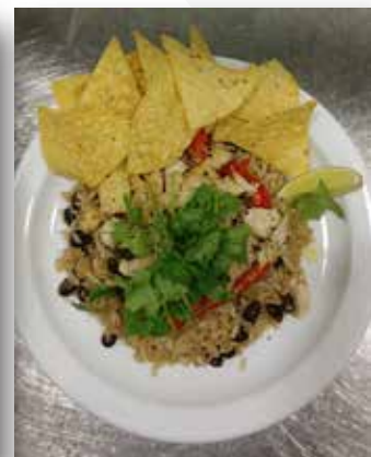
Premier repas servi à la cafétéria de l'ÉSC Nouvelle-Alliance 18 septembre 2017

10 apprentis cuisiniers ont mis la main à la pâte pour créer plusieurs plats délicieux. Les jeunes ont eu la chance d'aller visiter la ferme Moodance Organic Gardens à Angus, où ils ont travaillé dans la serre et ont fait la récolte d'oeufs dans le poulailler pour préparer la frittata du dîner. Pour célébrer leurs apprentissages, les jeunes ont accueilli parents et amis et ont cuisiné un repas pour 50 personnes! Une semaine inoubliable!