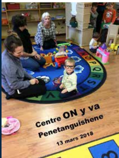
Centre ON y va Penetanguishene 13 mars 2018