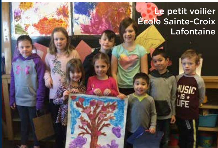
Le petit voilier École Sainte-Croix Lafontaine