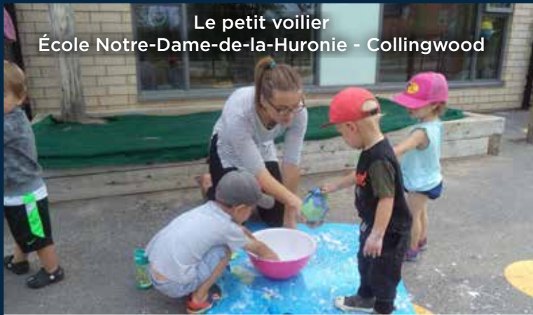
Le petit voilier École Notre-Dame-de-la-Huronie - Collingwood