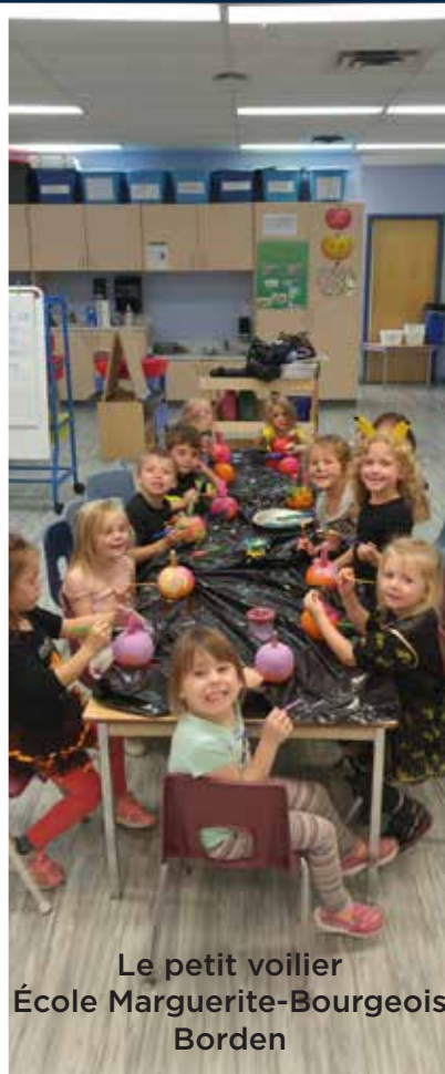
Le petit voilier École Marguerite-Bourgeois Borden