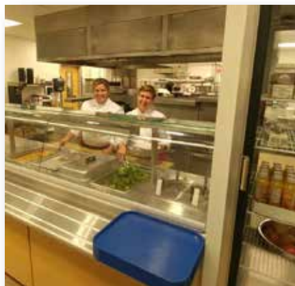
Nous préparons et servons des repas santé - incluant un bar à salade.

C'est avec beaucoup de fierté que La Clé ouvre en septembre 2017, un service de traiteur spécialisé à l'école secondaire catholique Nouvelle-Alliance à Barrie. En plus d'offrir le service de cafétéria de l'école, Le Gosier offrira des repas chauds et santé pour les enfants et les jeunes dans les garderies Le petit voilier. La philosophie de cette nouvelle entreprise sociale est de faire découvrir aux jeunes que manger santé a aussi bon goût. Le service vise l'achat d'un maximum de produits locaux et l'éducation des jeunes. C'est dans cette optique que le camp culinaire a été développé et que sa première édition a eu lieu lors de la relâche scolaire.